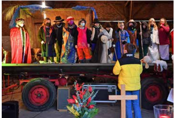
Bilder vom Krippenspiel 2021 auf dem Hof Magerhans